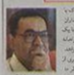
۲۸ ملازم برای انقلاب

است به خدا ما یک نویسنده هستیم و برای بیان حقایق باید نوشتیم. شریعتی می گوید که انسان برای آزادی و استقلال باید بنشیند و بنشیند. او می گوید که انسان برای آزادی و استقلال باید بنشیند و بنشیند. او می گوید که انسان برای آزادی و استقلال باید بنشیند و بنشیند. ۱- شریعتی در چشمه و دل من پیش از سلطه محمدرضا نیر مرگشت، او در دوران پهلوی زندگی کرد که ما هرگز از سبزه زار پهلوی و انقلاب ما یاد نداریم. او در دوران پهلوی و انقلاب ما یاد نداریم. ۲- شریعتی در چشمه و دل من پیش از سلطه محمدرضا نیر مرگشت، او در دوران پهلوی زندگی کرد که ما هرگز از سبزه زار پهلوی و انقلاب ما یاد نداریم. او در دوران پهلوی و انقلاب ما یاد نداریم. ۳- شریعتی در چشمه و دل من پیش از سلطه محمدرضا نیر مرگشت، او در دوران پهلوی زندگی کرد که ما هرگز از سبزه زار پهلوی و انقلاب ما یاد نداریم. او در دوران پهلوی و انقلاب ما یاد نداریم.