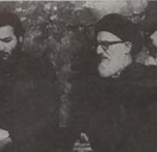
فکر از وی استناد کرد...